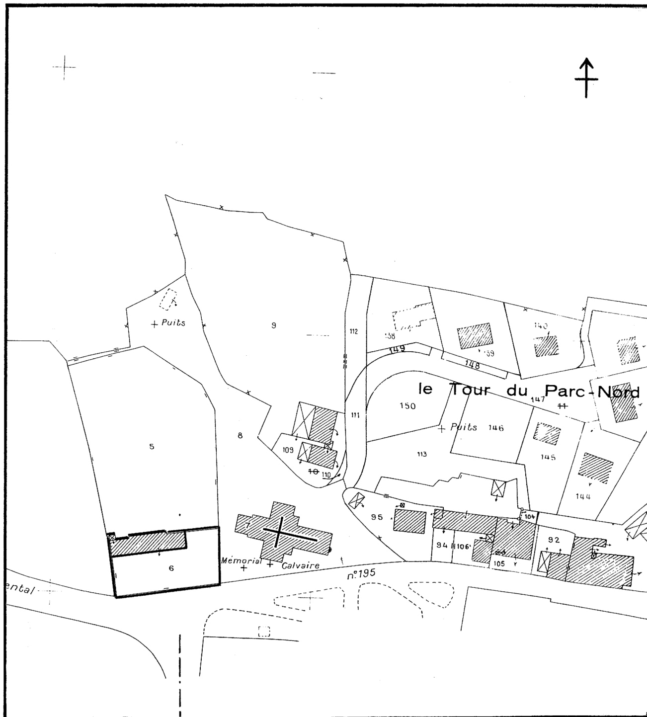
Pl. I. Plan de situation. Extrait cadastral 1979, section AH, échelle 1/2000e.