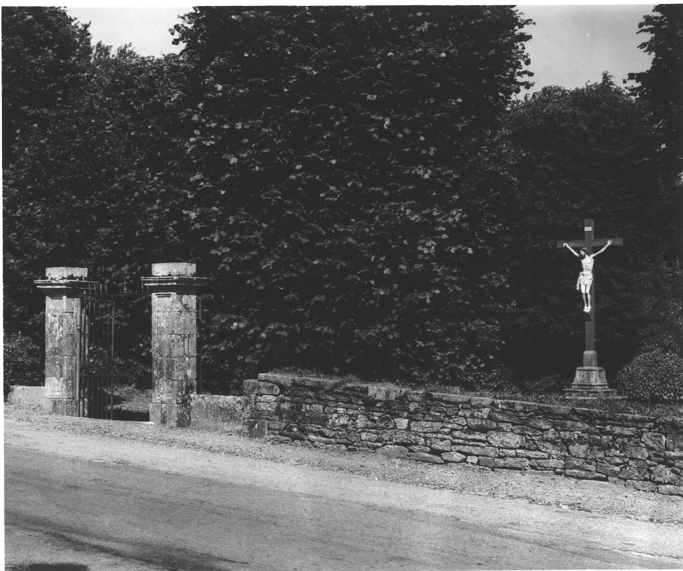
FIG.1 Vue generale Sud-Ouest 84 29 438 X.

29 PONT-CROIX Rue Marcel Pelly CROIX MONUMENTALE