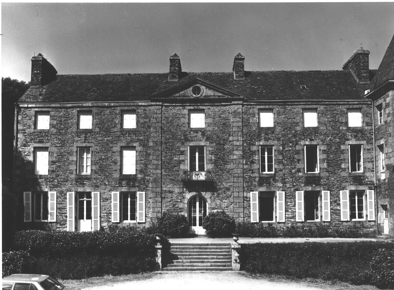
FIG.2 Corps de logis principal : Vue generale