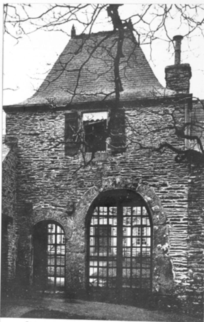
2517. - Châteauneuf-du-Faou. — Portail du Manoir de Keranmoal (XVII e siècle)