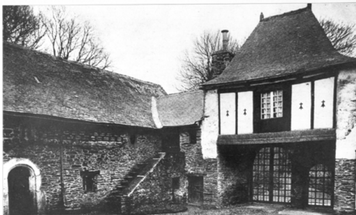
2528. - Châteauneuf-du-Faou - Cour du Manoir de Keranmoal (XVII e siècle)